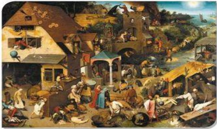
■ Фламандські прислів'я, або Світ догори дриґом (Пітер Брейгель старший, 1559)