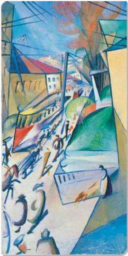
■ Трамвай (Олександр Богомазов, 1914)