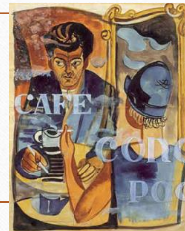
Анатолій Петрицький. Портрет поета- футуриста М.Семенка. 1929